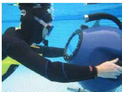
Prototype de simulateur de plongée en collaboration avec Virtual Dive et Ibisc.