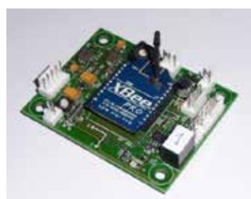
Développement de carte électronique