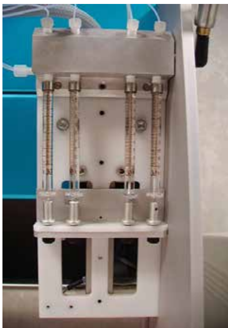
Module de pipetage microlitre