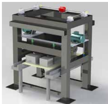
Machine spéciale unitaire